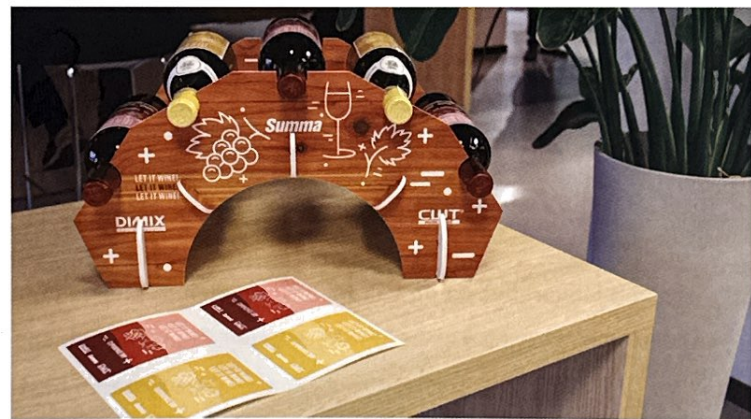
▲ Met snijden en afwerken voeg je waarde toe.